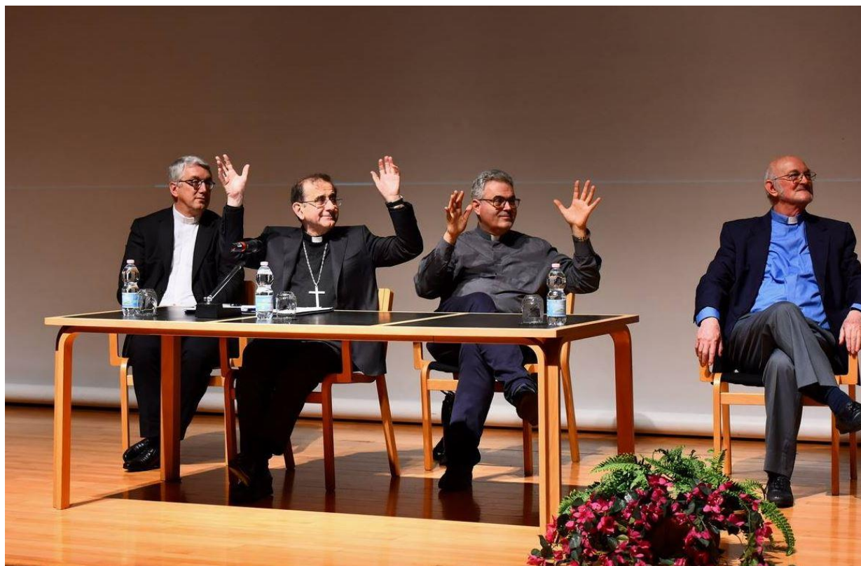
L'Arcivescovo Delpini durante l'ultimo incontro presso il Centro Asteria

fedeli che desiderano essere presenti in Duomo per l'Eucaristia vespertina presieduta dall'Arcivescovo.