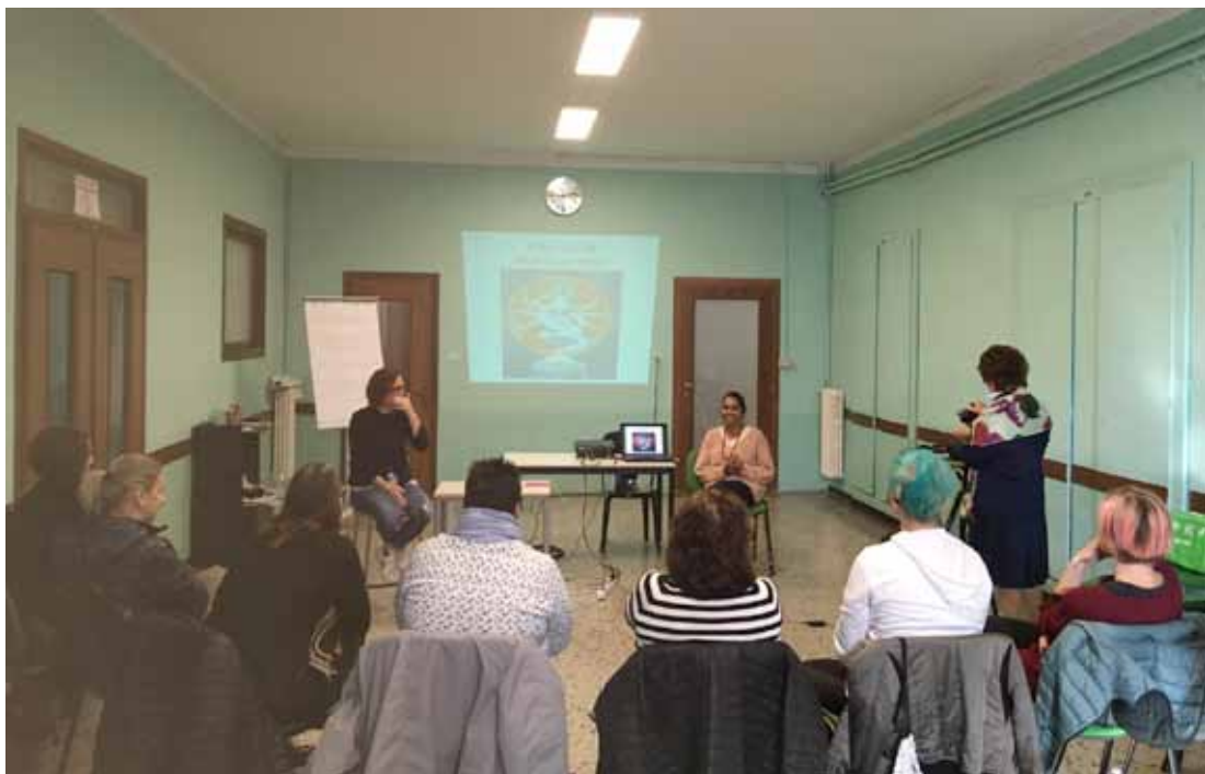
I partecipanti al primo incontro

Quest'anno, in continuità con i corsi precedenti, verrà approfondita la tematica della sessualità nel corso delle varie stagioni della vita. Nel primo incontro si è visto come la dimensione sessuale dell'individuo sia presente fin dall'inizio dell'esistenza per assumere col passare del tempo aspetti diversi, più complessi, idonei alla realizzazione dei compiti evolutivi legati alla crescita. Il diventare uomo o donna è un processo non solo generato da aspetti imm modificabili biologici e ormonali dell'individuo, ma è strettamente intrecciato alla cultura che plasma tutti gli aspetti della vita in cui la persona vive: ne avremo un vivido esempio con la testimonianza di una mediatrice culturale indiana che ci parlerà del Kamasutra, ovvero della sacralità della sessualità in India. Nel secondo incontro si è dato spazio in particolare ai rapporti all'interno della coppia: si fa conto sulla presenza di mariti e compagni, in risposta ai desideri delle partecipanti, che hanno auspicato la presenza dei partner agli incontri; si è parlato di