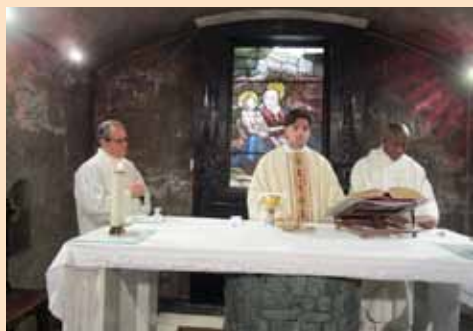
Santa Messa - San Francesco di Sales