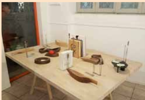
Ass. T12-lab - Christmas Art Party