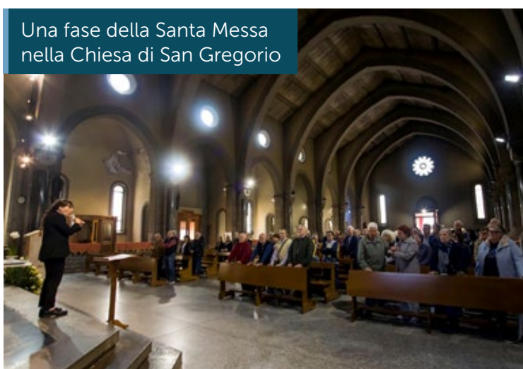
Una fase della Santa Messa nella Chiesa di San Gregorio