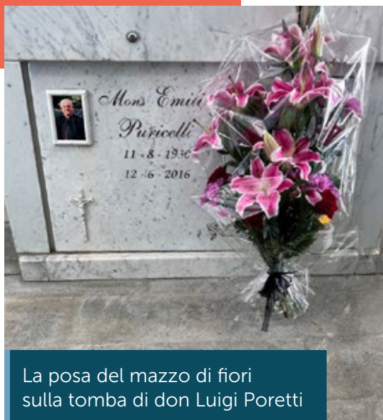
La posa del mazzo di fiori sulla tomba di don Luigi Poretti

Sono state anche riposte anche due mazzi di fiori sulle tombe di mons. Emilio Puricelli e don Luigi Poretti, entrambi riposanti nello stesso cimitero.