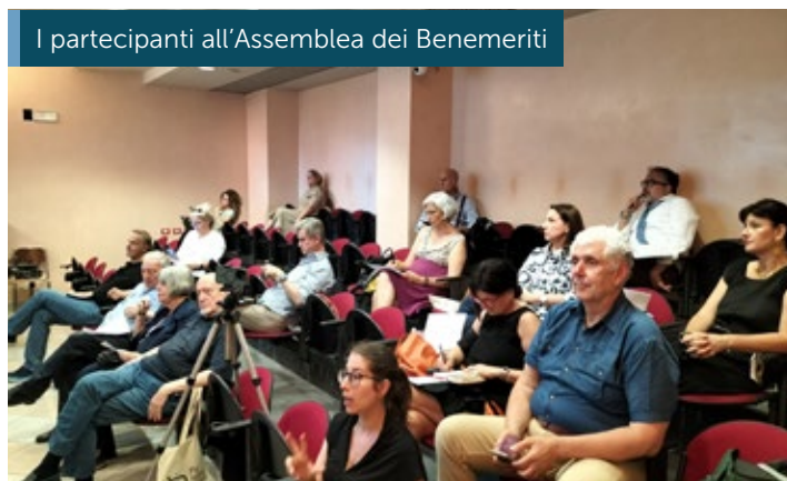
I partecipanti all'Assemblea dei Benemeriti

Il Presidente è passato poi ad introdurre il Bilancio economico e la Relazione di Missione, evidenziando il buon lavoro svolto nel 2025 ed i lusinghieri risultati economici conseguiti, anche a seguito della vittoria in Cassazione per la causa contro la Città Metropolitana. Tutto ciò ha consentito di acquisire ulteriori risorse, che in parte sono state destinate ad incrementare l'attività filantropica