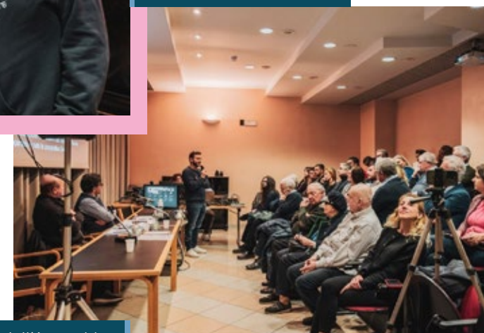
Una veduta dell'Assemblea