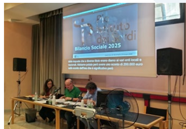
La fase di presentazione del Bilancio Sociale 2025